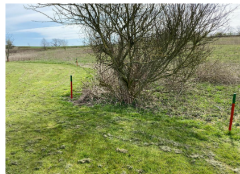
Bild: Bahn 3 rechte Seite

2-9 Austausch der Plastikpfähle in weiße, gelbe und rote Holzpfähle mit (teilweise) grünem Kopf