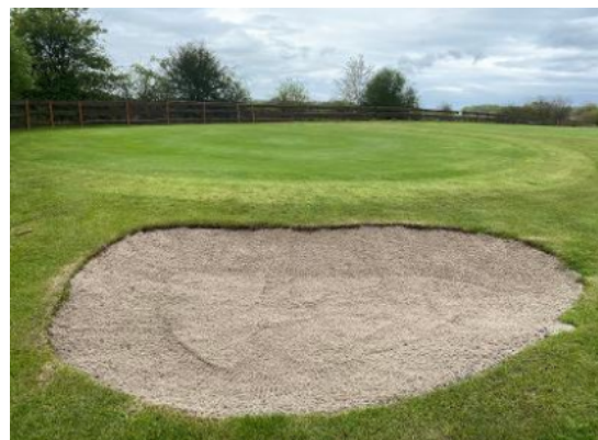
Bild: neuer Bunker vor dem Chipping Grün