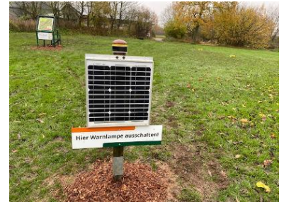
Bild 7: Buzzer